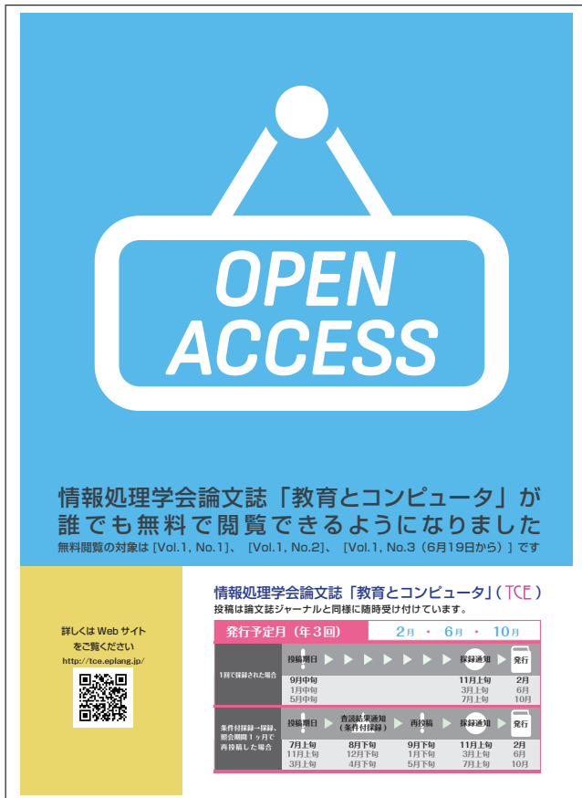
図 2 TCE オープンアクセスのおしらせ

稿時のまま採録が決定) の場合には、査読日数は平均 74.5 日であるが、照会回数が 1 回で 222.3 日であり、照会回数が 2 回、3 回となると、それぞれ、335.6 日、420.3 日と非常に長い期間となってしまっている。