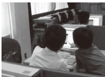
図-1 情報科学教室でアルゴリズムに取り組む親子

さらに、区立小中学校のICTリーダー研修についても協力することとなった。文京区では、ICT機器の利活用のために、小学校20校、中学校10校から各校1名の教員がICTリーダーとなっている。年5回のICTリーダー研修では、各校での授業の参観、他区のICT先進校の見学と、ICTリーダーが取り組んだ実践結果の報告を行っている。筆者は、本会コンピュータ教育研究会（CE）や、「会員の力を社会につなげる」研究グループ（SSR）で、高等学校の先生方と連携した活動をしてきたが、文京区のICTリーダー研修にかかわることにより小学校の先生方と知り合うことができ、2014年11月には、足立区小学校研究会視聴覚部の研究授業にもお招きいただいた。2013年6月の「世界最先端IT国家創造宣言」の閣議決定では、「初等・中等教育段階からプログラミング、情報セキュリティ等のIT教育」が謳われている。小中学校における情報教育は、本会が取り組むべき重要な課題 ☆4 であり、これからも、小中学校の先生方との連携の機会を増やしていきたいと考えている。