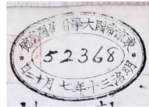
【図3】蔵書印「東京帝国大学附属図書館 52368 明治三十年七月十二日」 T20-956『求力論』より

一方、和算書の収集事業期間中に登録された冊子には、[図3]のような楕円形の蔵書印が捺されている。中央の数字は図書館全体での登録番号で、下部には登録された日付が記されている。この日付を全て確認することで、各冊子の登録年月日が判明する。