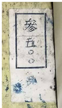
【図2】「参五〇〇」と記された蔵書票。 T20-112『算法側円詳解』表紙より

和算書収集事業の始まる以前から所蔵されていた和算書の表紙には、[図2]のように「参××」と記す蔵書票が貼付されている。これらのほとんどは関東大震災時に学士院には貸し出されておらず、図書館内で火災に遭っている。そのため、一部の冊子には焼け焦げた跡や消火のための水を被った痕跡が生々しく残っている。この票の有無が収集事業以前の所蔵書の識別基準となり、全62タイトルを数える。 (11)